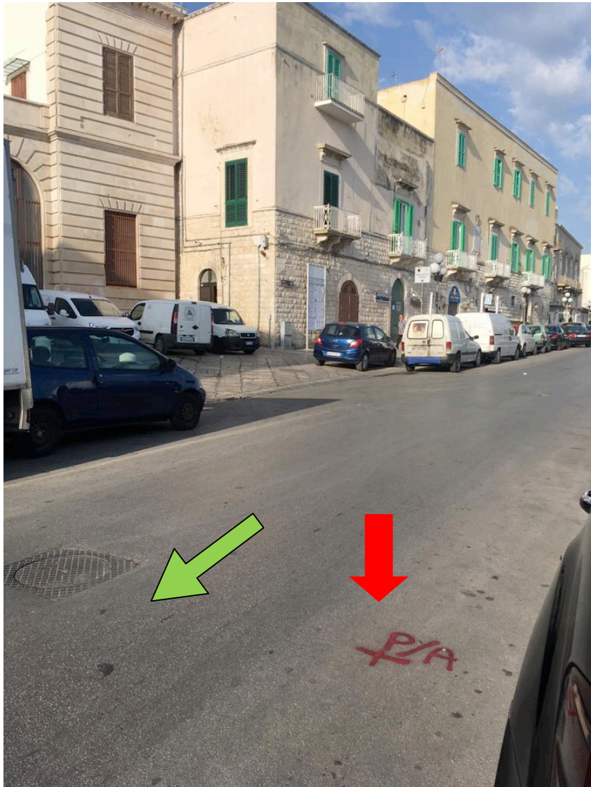
Via San Domenico n.1 altezza "Monumento al Marinaio"