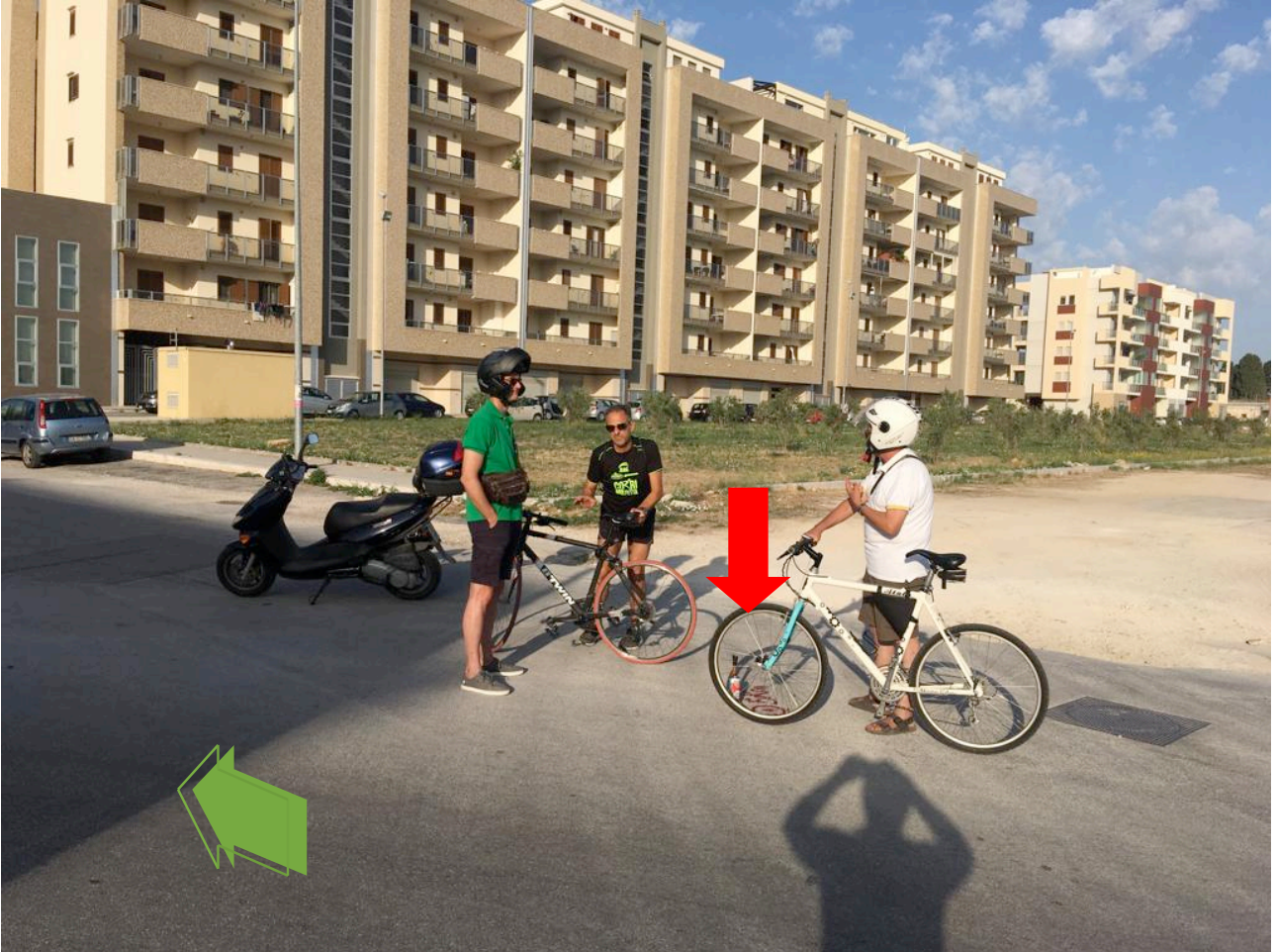
Via Caduti sul lavoro incrocio strada privata